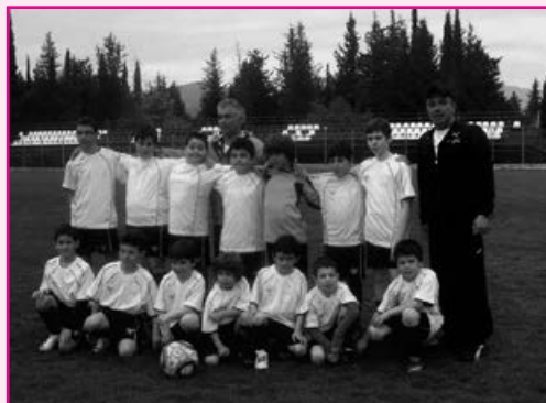
Η ομάδα παιδιών του συλλόγου μας όπως αγωνίστηκε το 2012

Την ΜΕΓΑΛΗ ΠΑΡΑΣΚΕΥΗ το μεσημέρι στο γήπεδο του Πέτα θα πραγματοποιηθούν οι καθιερωμένοι φιλικόι ποδοσφαιρικοί αγώνες μεταξύ των ομάδων ΠΑΛΑΙΜΑΧΟΙ Α.Ο. ΦΙΛΕΛΛΗΝΕΣ – ΑΔΕΛΦΟΤΗΤΑ και των ΠΑΙΔΙΚΩΝ ΤΜΗΜΑΤΩΝ.