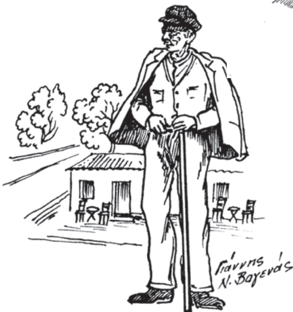
Γιάννης Ν. Βαγενάς