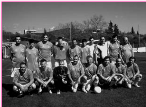
Η ομάδα Ανδρών του συλλόγου μας όπως αγωνίστηκε το 2012