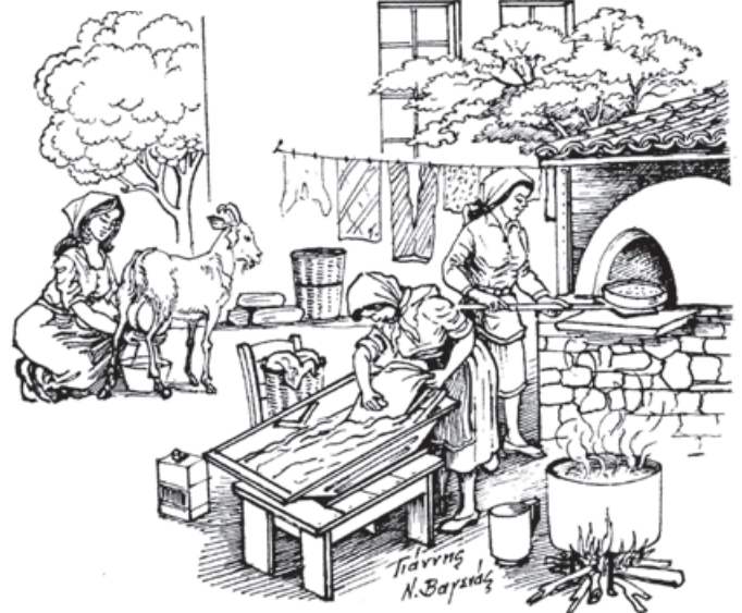
Γιάννης Ν. Βαγενάς