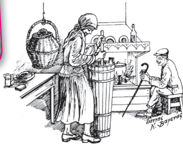
Γιάννης Ν. Βαγενάς