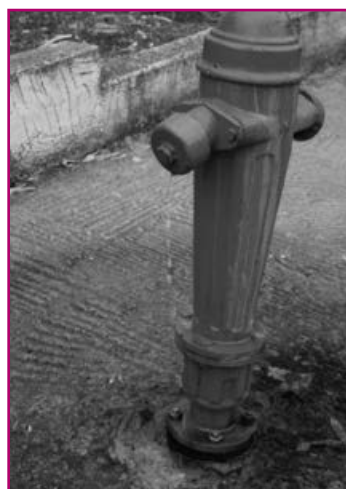
Ολοκληρώθηκε το νέο δίκτυο ύδρευσης του χωριού

Σε ανακοίνωση του δήμου παρακαλούνται οι χρήστες του δικτύου, εντός του Ιανουαρίου 2014 να