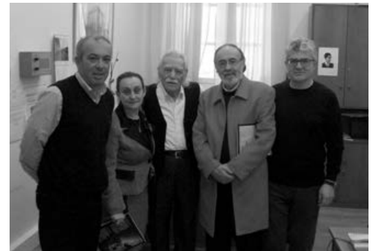
Τον αγωνιστή της Αντίστασης Μανώλη Γλέζο επισκέφτηκε στο γραφείο του στη Βουλή και τίμησε αντιπροσωπεία της Αδελφότητας.