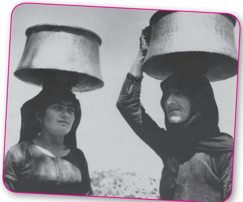
Νερό απ' την πηγή. Στους παλαιότερους θυμίζει νερό απ' την Κούρζα.