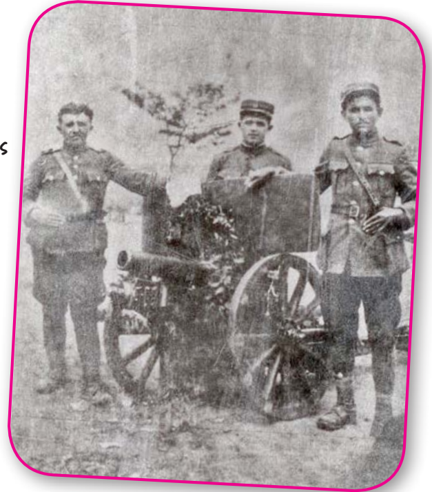
ΣΤΡΑΤΙΩΤΕΣ ΠΕΔΙΝΟΥ ΠΥΡΟΒΟΛΙΚΟΥ 1924-1927, Πάσχα στο ακραίο Γιάννενα, 22 Απριλίου 1927.