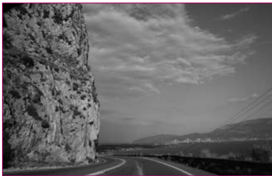
Η λύση της σήραγγας αποφασίστηκε στην Παλιοβούνα

Ήδη έχουμε τις πρώτες διαμαρτυρίες συμπολιτών μας που θίγονται ιδιαίτερα από το νέο χαράτσι που επέβαλαν οι μεγαλοεργολάβοι.