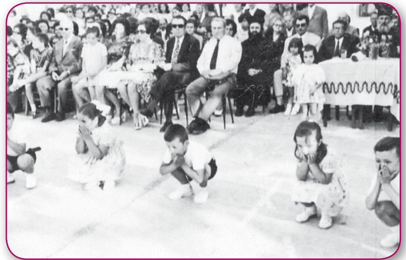
1972. Γυμναστικές επιδείξεις στην πλατεία του Πέτα