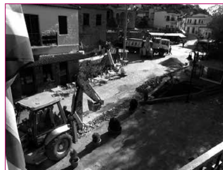
Τα έργα της αποχέτευσης βρίσκονται σε εξέλιξη

Τη Μεγάλη Εβδομάδα έγινε η καθιερωμένη συνάντηση του Δημάρχου Στάθη Γιαννούλη με το Δ.Σ. της Αδελφότητας Πετανιτών. Από τη δημοτική αρχή συμμετείχε και η Αντιδήμαρχος Ροζίνα Βαβέτση.